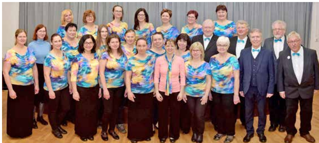
Koncert „Pocta české hudbě“ se uskuteční v neděli 11. června v 18 hodin v Městském domě.