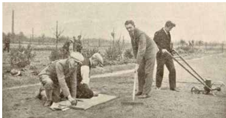
Takhle vypadal praktický výcvik na pokusném poli v počátcích historie školy.

Text vznikl ve spolupráci se Státním okresním archivem Přerov. (voj)