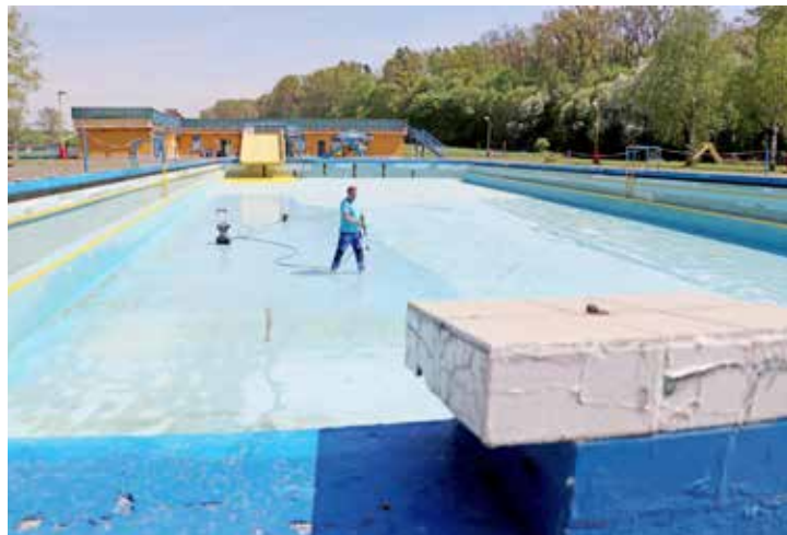
Koupaliště v Penčicích otvírá v sobotu 3. června.

kilogramů modré barvy, opraveny byly také keramické obklady. Samozřejmostí je každotýdenní sekání trávy a likvidace plevelů. A jaké vyžití areál v Penčicích nabízí? „U dětského desetimetrového bazénu je v provozu krátká dětská skluzavka, u „padesátek“ velká dvouproutdová skluzavka. Pro vyznavače nudismu je připravena diskrétní nudistická terasa. Kolem bazénu je travnatá plocha určená ke slunění – k relaxaci je možné použít 74 dřevěných lehátek. Pro sportovní účely slouží hřiště na volejbal či nohejbal. Kapacita vodní plochy postačuje pro 226 koupajících, maximální denní kapacita areálu je maximálně 1 130 návštěvníků,“ připomněl jednatel společnosti. Vstupné pro letošní rok činí 70 korun, zlevněné pak 60 korun. (voj)