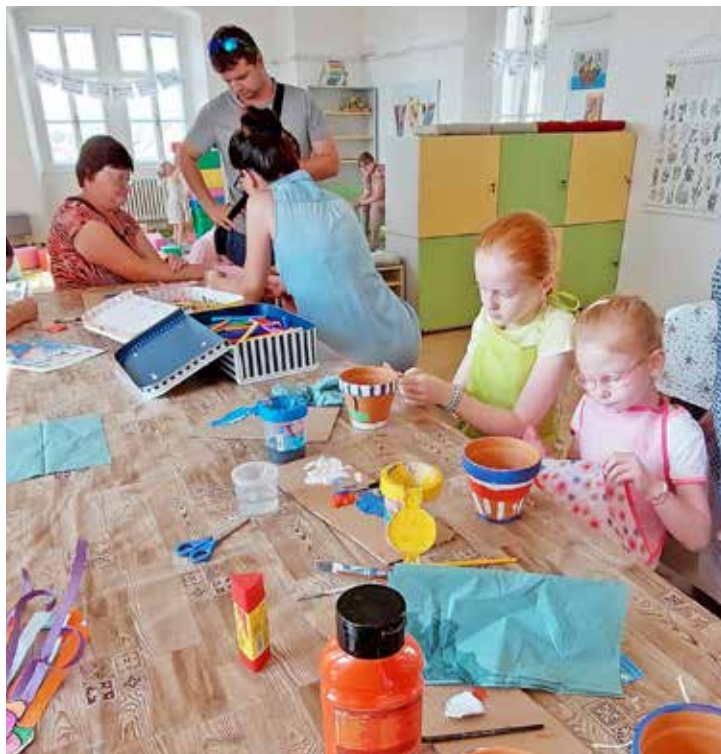
Výtvarné workshopy ve Vševedárně zámku jsou mezi dětmi oblíbené.