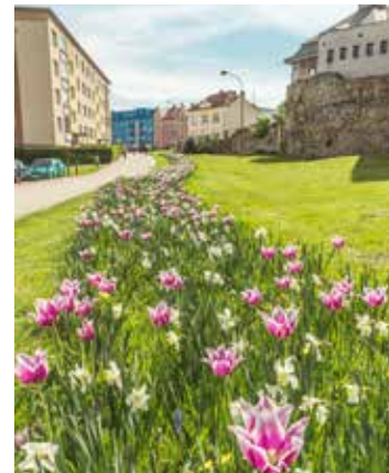
Záhony s cibulovinami zdobí každoročně i prostranství pod hradbami.

lokalitou bude park v ulici Svisle. Třetí, námi vybranou lokalitu, už můžeme odtajnit – bude to nábreží PFB podél cyklostezky. Tyto tři nové lokality přibudou k devíti už realizovaným. Na podzim pak provedeme v ulicích města další výsadbu stromů a keřů. Počty a lokality v současné době upřesňujeme. Od jara do podzimu budeme také udržovat trávníky ve městě – podle potřeby upravujeme veřejná prostranství až desetkrát za rok. Na jaře a na podzim sečeme trávu na výšku asi 9 centimetrů. V průběhu léta, kdy hrozí vysychání půdy, sečeme na maximální výšku pojezdového profilu sekaček, tedy zhruba na 12 centimetrů. Zvláště šetrně zkracujeme trávu v Michalově a v místech, kde rostou lilie. Na dětských hřištích bývá tráva zkrácena na 7 centimetrů.“ (voj)