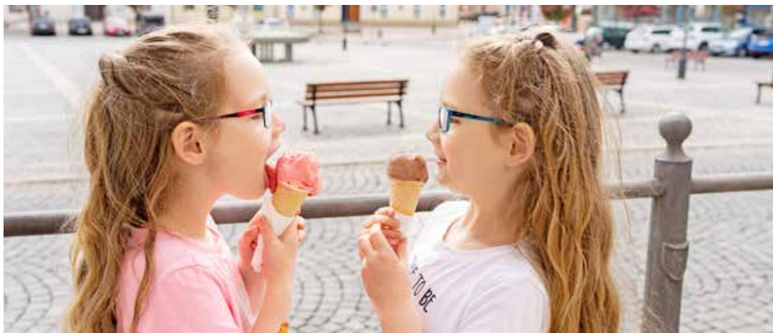
Léto je tu, děti si pochutnávají na chladivé zmrzlině a někteří rodiče stále řeší, kde jejich ratolesti stráví dva měsíce prázdnin. Jednou z možností jsou příměstské a pobytové tábory. Průřez nabídkou přerovských organizací přinášíme na straně 9.

Ročník XXII • Číslo 6/2023 • www.prerov.eu • www.facebook.com/televizeprerov