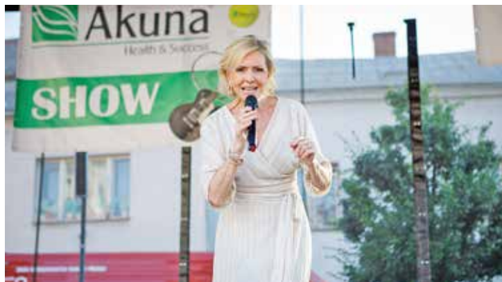
Mezi oblíbené hosty AKUNA SHOW patří zpěvačka Helena Vondráčková.